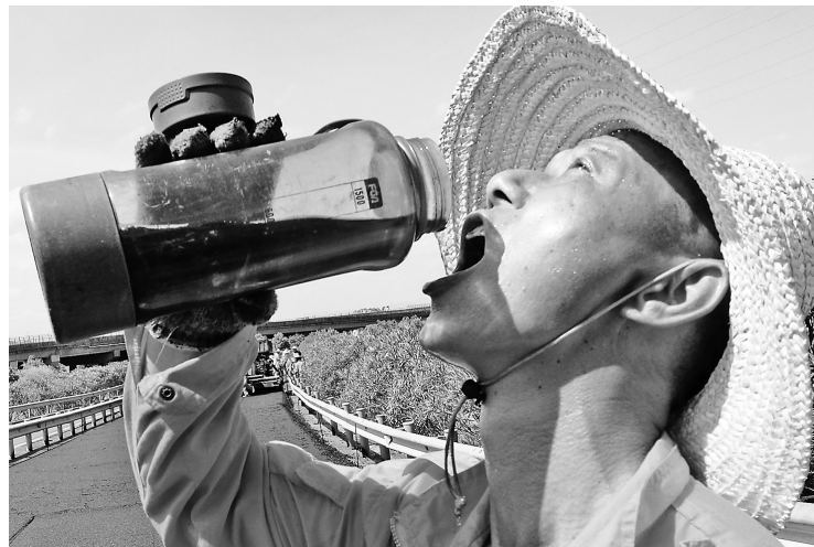
高温下作业,工人要喝大量的水。

沥青摊铺结束后,养护工要在上面走动检查,哪里不平整就要及时修补,并测量温度是否合