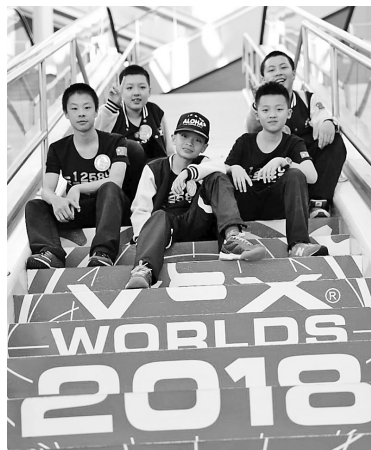
5名学生在美国合影。