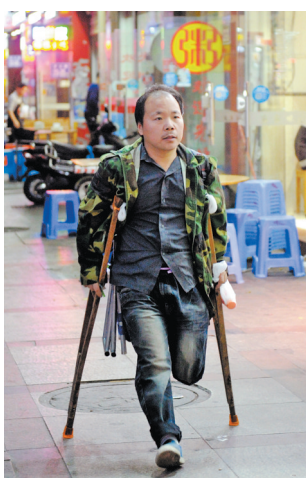
他拄着拐杖上街摆摊。