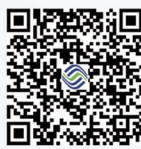
“宽带电视预约” 二维码