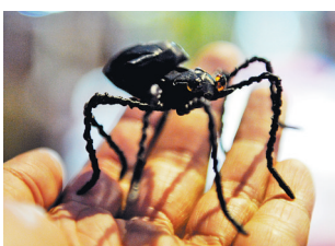
他编织的蜘蛛栩栩如生。

记者采访当天,他下午4点多出门摆摊,但偏偏下了雨。在记者的帮助下,他匆忙用塑料布